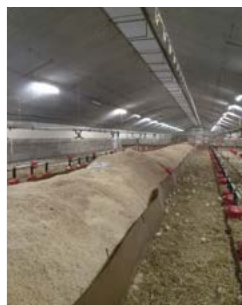
Des barrières bloquent l'accès à l'andain pendant les premiers jours.

La mise en place de l'andain de copeaux se fait avant l'arrivée des dindonneaux. La mise en place dans un bâtiment de 1200 m 2 dure 4 heures. L'éleveur ajoute ensuite de la paille broyée sur les côtés. Ce sont les animaux qui étaleront les copeaux lors de leurs déplacements.