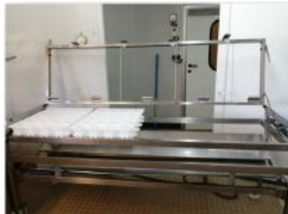
Vis pour fermer la table de retournement

Après le moulage, la plaque supérieure de la table est fermée et se bloque à l'aide d'une vis. Elle peut être tournée à 360°.