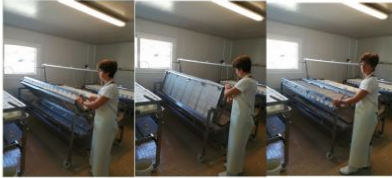
Retournement de 360° de la table